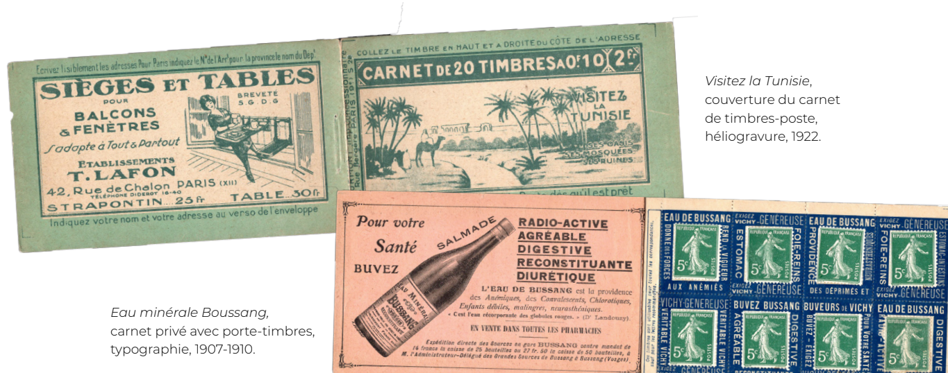
Eau minérale Bussang, carnet privé avec porte-timbres, typographie, 1907-1910.

De nombreuses maquettes originales d'artistes seront dévoilées pour la première fois au public. L'exposition est aussi l'occasion pour le Musée de La Poste de valoriser l'acquisition faite en 2011 d'un ensemble de 200 carnets de timbres datant du début du XX e siècle. Cette exposition propose une histoire vivante, mettant en évidence les liens profonds entre l'univers postal, la société française et les évolutions culturelles au fil du temps.