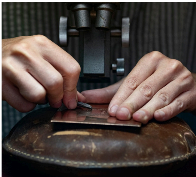
GRAVURE EN TAILLE-DOUCE - ATELIER DE SARAH BOUGAULT PARIS, LE 7 JUILLET 2025

La photographe Sophie Brändström a suivi pendant plusieurs mois graveurs, imprimeurs et collectionneurs qui perpétuent l'art du timbre gravé en taille-douce — savoir-faire inscrit à l'inventaire français du patrimoine culturel immatériel, pratiqué aujourd'hui dans seulement trois pays au monde. Un hommage sensible et documenté à ceux qui font vivre un artisanat d'exception, transmis de génération en génération.