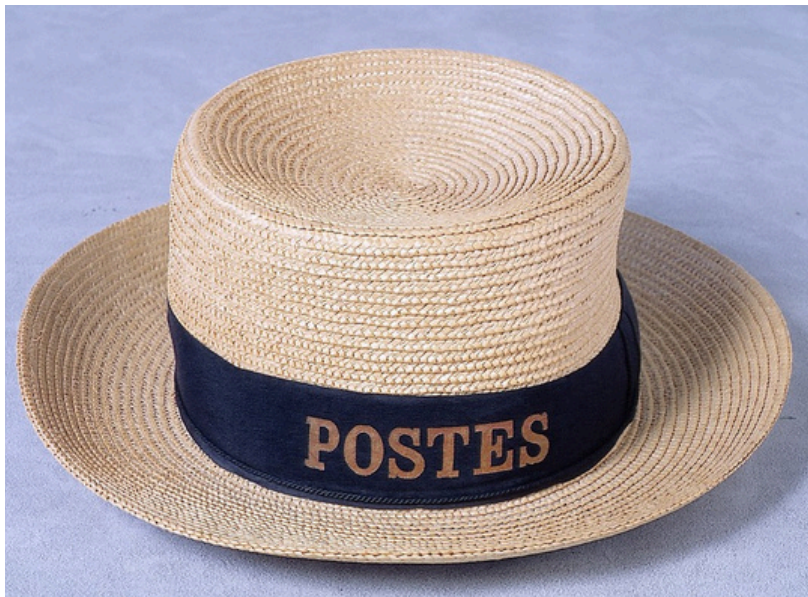
CHAPEAU D'ÉTÉ DU FACTEUR RURAL COLLECTION MUSÉE POSTAL

Endosser un uniforme, enfile un bleu de travail, porter la tenue d'une entreprise : des gestes simples, chargés de sens. Sous toutes les coutures. Le vêtement au travail retrace plus de deux siècles d'histoire sociale, technique et esthétique du vêtement professionnel. Des premiers uniformes civils aux créations de grandes maisons de couture comme Balenciaga, Balmain ou Carven, l'exposition explore aussi la lente conquête d'un vestiaire féminin au travail. Une expérience immersive et documentée, portée par des pièces issues des collections du Musée Postal et d'institutions partenaires.