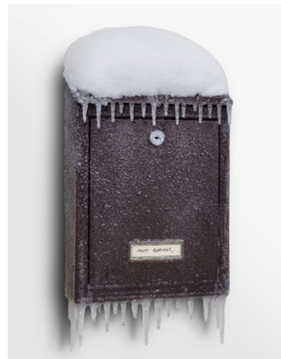
NATURE MORTE - BOÎTE AUX LETTRES (MON AMOUR) LAURENT PERNOT 2026

En puisant dans les correspondances anciennes des collections du musée, l'artiste pluridisciplinaire Laurent Pernet a imaginé une exposition consacrée à l'amour en temps de guerre. Des lettres transportées par ballons lors du Siège de Paris aux mots d'amour traversant les conflits d'aujourd'hui, ses installations — mobiles, projections, objets figés dans la glace — dessinent une conversation qui traverse le temps. Une œuvre contemplative, portée par la conviction que les mots d'amour résistent à l'histoire et à l'adversité.